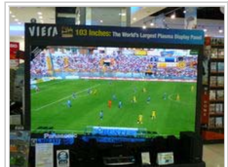
Plazmový televizor s úhlopříčkou 261 cm

Plazmová obrazovka nebo také plazmový displej je typ plochého zobrazovacího zařízení používaná pro televizory s velkou úhlopříčkou (minimálně 80 cm). Název plazmová je odvozen od použité technologie využívající malé buňky s elektricky nabitými částicemi ionizovaného plynu.